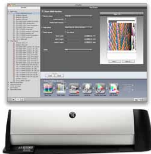
i1iSis 2 et i1 Profiler : Rapidité et facilité d'emploi combinées

www.xrite.com/i1iSis-2-automated-chart-readers