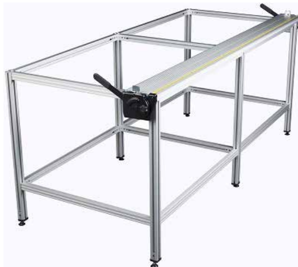
▲ Big Bench Xtra