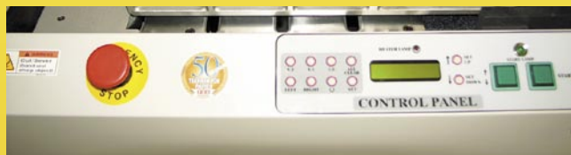
Tableau de commandes