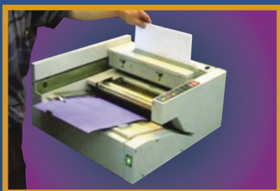
Mettre les feuilles dans le chariot