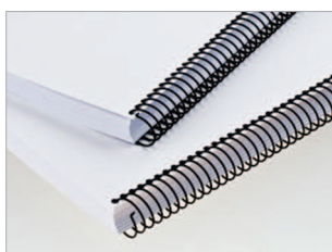
Reliure par spirales hélicoïdales métalliques ou plastiques.