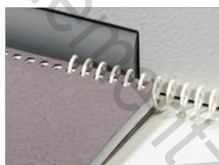
Insertion électrique de la spirale dans la liasse.