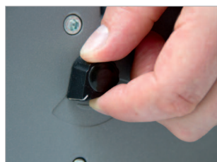
Marge de perforation réglable.