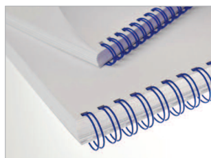
Reliures anneaux métalliques disponibles en plusieurs coloris.