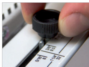
Curseur permettant l'ajustage du système de sertissage.