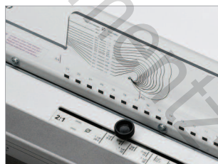
Curseur permettant l'ajustage du système de sertissage.