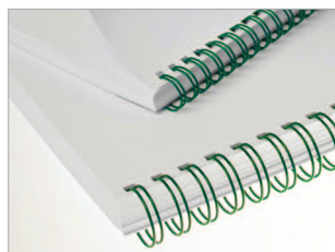
Reliures anneaux métalliques disponibles en plusieurs coloris.