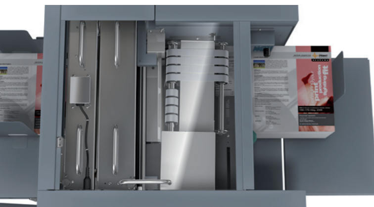
Modules de micro-perforation et de refente en option