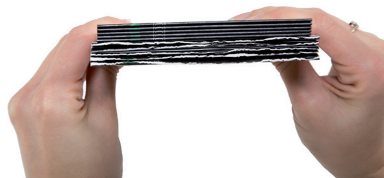
Intérêt du rainage pour les travaux numériques