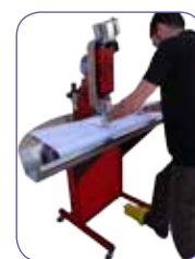
Stand optionnel avec tablette en acier inoxydable