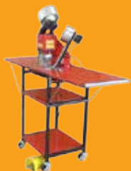
Table optionnelle avec rabats