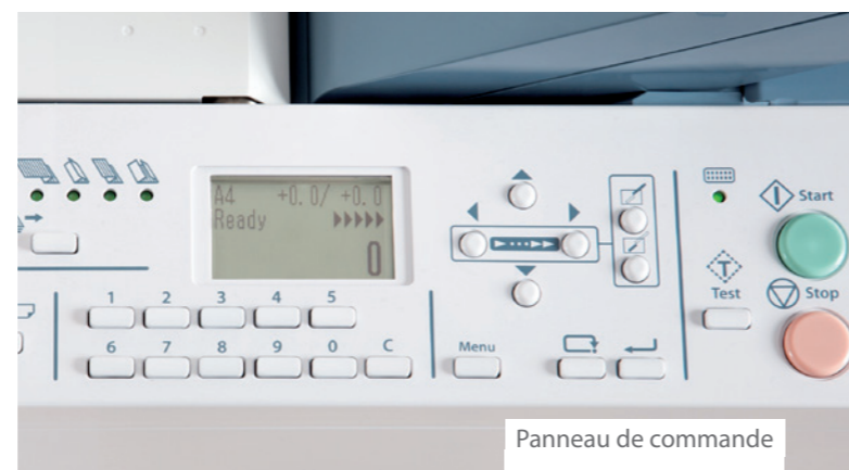
Panneau de commande