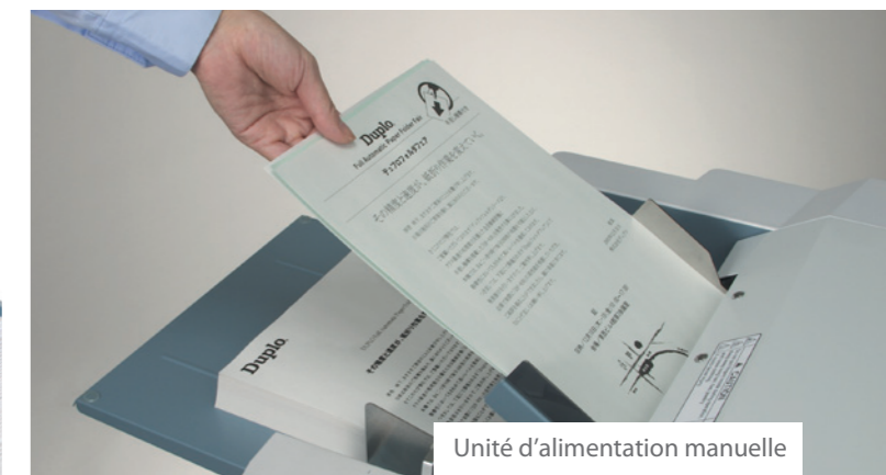
Unité d'alimentation manuelle