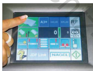
Grand écran de commande tactile pour effectuer tous les réglages.