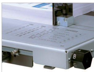
Plateau coulissant FlexoDrill avec tabulateur programmé.

(1) en feuilles 80 g/m 2 . * les forets Ø 10 à 14 mm nécessite un douille spéciale disponible en option. Caractéristiques techniques non contractuelles. Modifiables sans préavis. Sauf erreurs typographiques.