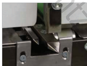
Traite des liasses d'imprimés offsets et numériques mixés.