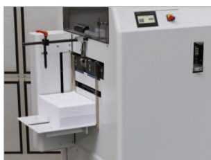
Table d'alimentation haute pile (jusqu'à 4000 feuilles).