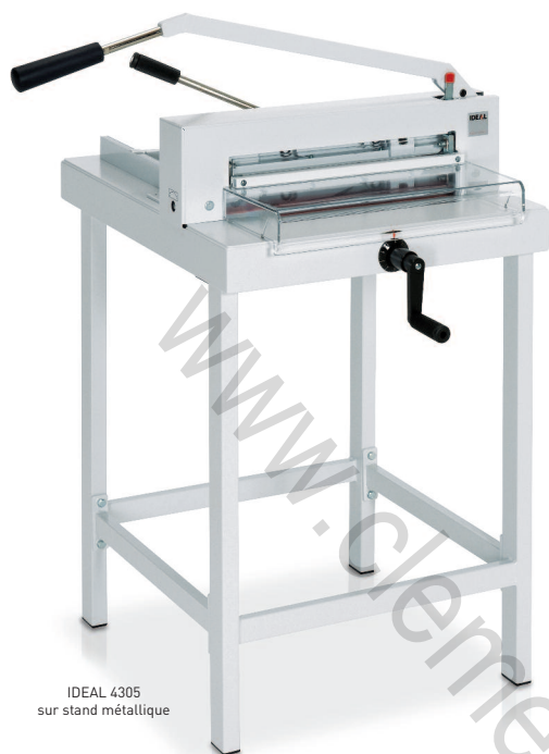
IDEAL 4305 sur stand métallique

Caractéristiques techniques non contractuelles. Modifiables sans préavis. Sauf erreurs typographiques.