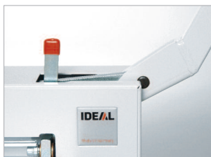
Dispositif de blocage de lame (levier en position haute).