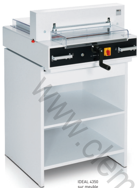
IDEAL 4350 sur meuble

(1) en feuilles A4, 70 g/m 2 . * sur stand métallique. ** sur meuble. Caractéristiques techniques non contractuelles. Modifiables sans préavis. Sauf erreurs typographiques.