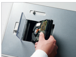
Ouverture réglable par curseur selon le format du disque dur introduit.