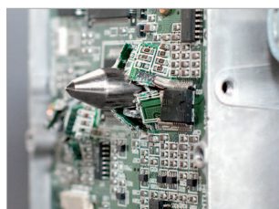
Perforation du disque dur un poinçon en acier trempé nickelé.