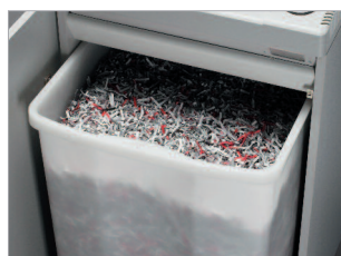
Réceptacle pratique de 165 litres avec poignée de préhension.