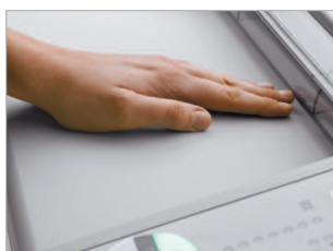
Volet de sécurité contrôlé électroniquement au niveau de l'ouverture.