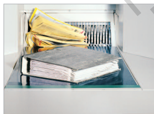
Détruit des classeurs complets, mécanisme inclus !