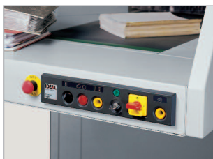
Interrupteur principal cadenassable et contacteur à clé.

GARANTIE 5 ANS SUR LES CYLINDRES DE COUPE CC