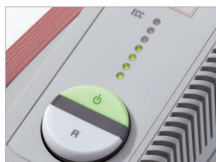
Commande EASY-SWITCH et système anti-bourrage ECC.