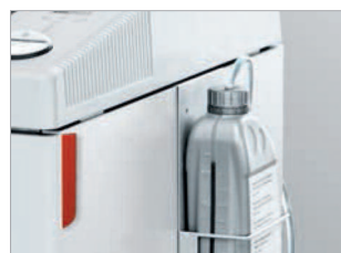
Lubrification automatique des cylindres de coupe.