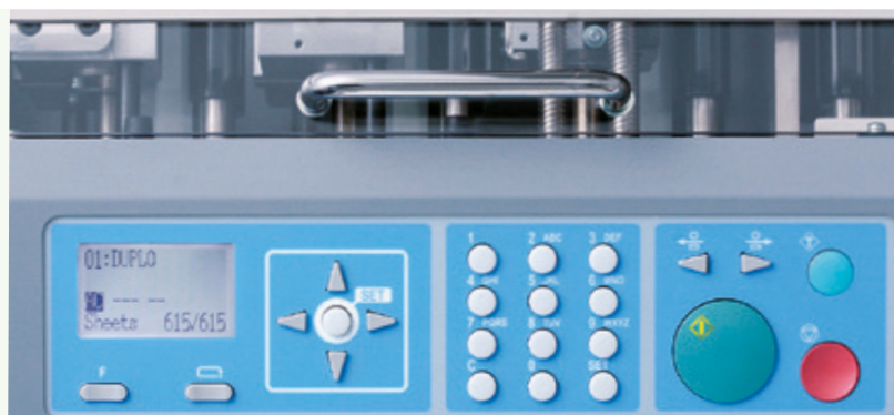
Afficheur à écran tactile