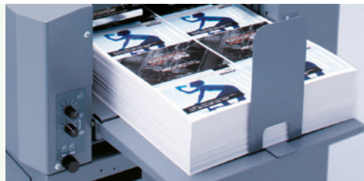
Margeur grande capacité