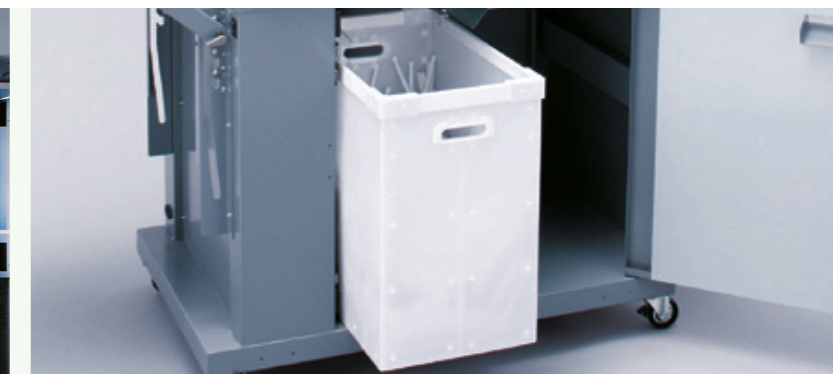
Bac de récupération grande capacité