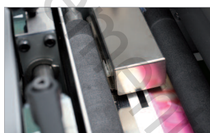
Lecteur de repère de coupe (adapté à l'impression numérique).