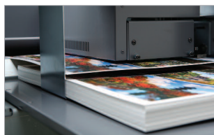
Prise papier à suction avec vitesse variable.