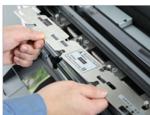
Changement du gabarit InstaSet facile et rapide.