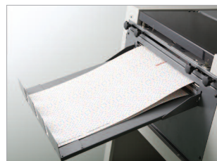
Plateau de réception adapté aux documents longs.