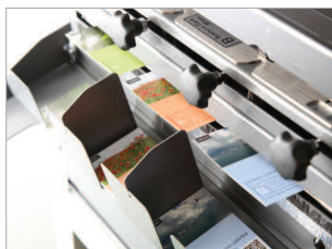
Plateau de réception pour cartes de visites, cartes postales, photos.