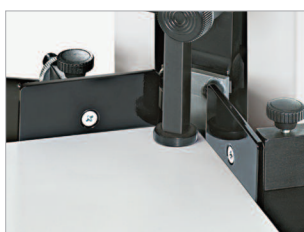
Butées de profondeur et latérales réglables en continu.