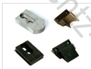
Exemples de couteau coin arrondi, couteau droit et matrices.