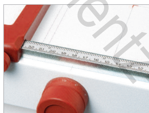
Butée latérale graduée en millimètres et en pouces.