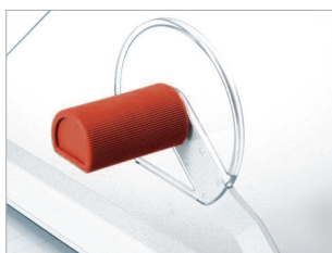
Dispositif de pression manuelle dosable par levier.