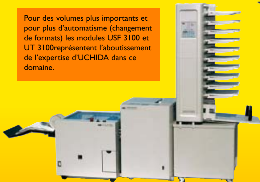
UT 3100 USF 3100 UC 1100

L'USF 3100 est prévue pour des cadences jusqu'à 3100 liasses/heure avec 5 formats standards mémorisés et 4 programmes pour formats spéciaux. Le massicot UT 3100 a été conçu selon des normes de robustesse en adéquation avec les efforts demandés à ce type de machine.