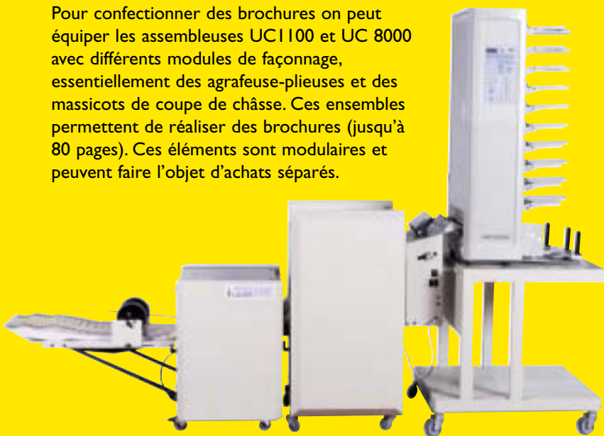
Kastrim Kasfold 5000 UC 1100

En entrée de gamme les modules KAS, agrafeuse-plieuse, écraseur et massicot de coupe de châsse, à changement de formats manuel, autorisent des cadences de l'ordre de 1500 brochures à l'heure en A4 et A5 (format brochure).