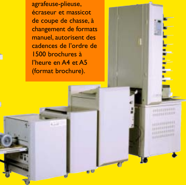
Kastrim Kaspress Kasfold 5000 UC 8000

Pour des volumes plus importants et pour plus d'automatisme (changement de formats) les modules USF 3100 et UT 3100 représentent l'aboutissement de l'expertise d'UCHIDA dans ce domaine.