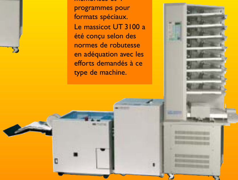
UT 3100 USF 3100 UC 8000

Toutes nos agrafeuses plieuses utilisent des chargeurs de 5000 agrafes pour une plus grande autonomie. Elles sont toutes équipées de riveurs mobiles pour rabattre les pattes de l'agrafe à plat. Les agrafeuses-plieuses KASFOLD 2000 et 5000 HCS, ainsi que l'USF 3100 peuvent fonctionner en alimentation manuelle (kit en option sur USF 3100).