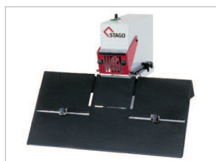
Plateau pivotant pour réaliser de l'agrafage à cheval (brochures).