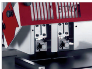
Carter de protection des têtes d'agrafage (utilisation sécurisée).