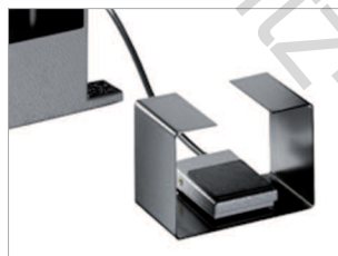
Agrafage électrique déclenché par pédale.